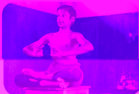
«Tontu» (survam), par Kuttanercery Sanghi Chokkayar, Ecole du Kalamandalam, Kalarî du maître Ramu Chokkar, 1999 par Virginie Johán

MAISON DE LA RECHERCHE Sorbonne Nouvelle – Paris 3 4 rue des Irlandais 75005 Paris