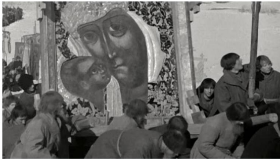
Sergueï Eisenstein, image extraite d'Ivan le Terrible, 1945.

Le 15 octobre 2019, par Christophe Averty