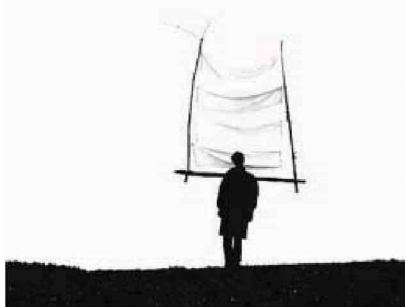
Clément Cogitore, Porteur (2004).

Le Centre d'art Transpalette invite une trentaine d'artistes internationaux à mettre en scène les plantes et autres créatures symbiotiques à l'occasion de l'exposition « OuVert ». À partir de ce samedi et jusqu'au 18 janvier, ils réfléchissent aux interactions entre l'homme et le règne végétal à travers des performances, de la danse (ce week-end), des colloques, des ateliers... www.emmetrop.fr