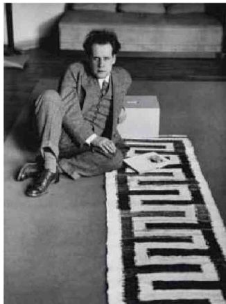
Sergei Eisenstein, en 1928, photographié par André Kertész.

Homme de théâtre et de littérature, dessinateur, théoricien, collectionneur et lecteur insatiable, Sergueï Eisenstein, réalisateur mythique qui fit la gloire du cinéma soviétique, est bien plus qu'un cinéaste. Le Centre Pompidou-Metz propose une rétrospective de son œuvre protéiforme jusqu'au 24 février. www.centrepompidou-metz.fr